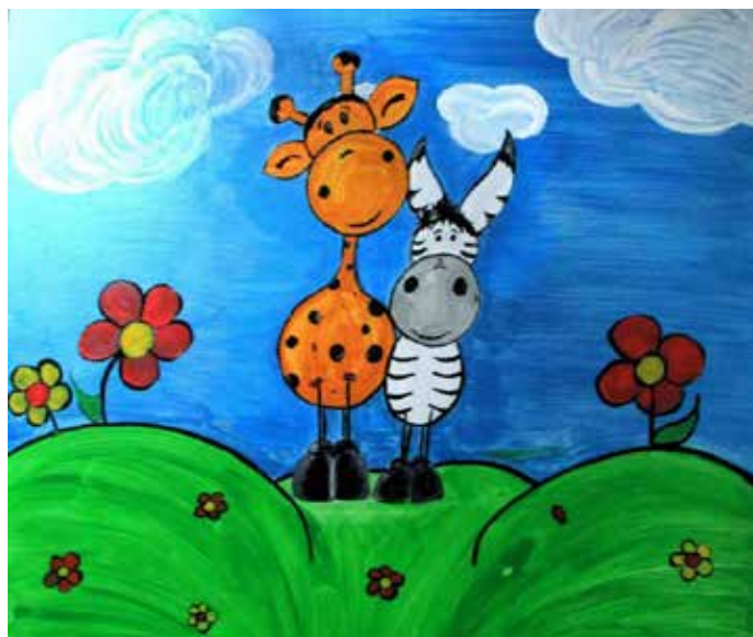
Bunt und schön. Eines der ersten Bilder malte Julia Stein.

tor Harald Blümel vorläufig. Blümel: „Ich anerkenne die noble Geste der Künstlerin, das Gemälde der ev.-ref. Kirchengemeinde Bösingfeld als Leihgabe zu überlassen und danke ihr dafür. Und Sie lade ich ein, gelegentlich einmal vorbeizuschauen und sich von dem Bild inspirieren zu lassen. Sie haben also einen Grund mehr, das Haus an der Mittelstraße 43 zu besuchen. Möglicherweise werden Sie das Gemälde auf Anhieb schön finden. Wenn nicht, erst nach mehrmaligem Betrachten.“ Text Privat