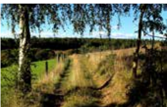
Idylle am Haferkamp