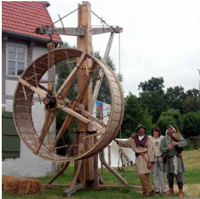
Der Laufradkran ist eine Attraktion bei mittelalterlichen Veranstaltungen.