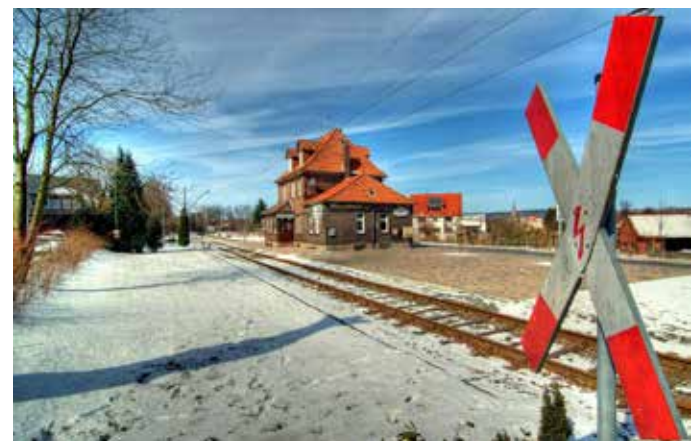
Das neu gestaltete Bahnhofsgelände. Der Alverdisser Bahnhof ist der Zielpunkt der Draisinenstrecke.