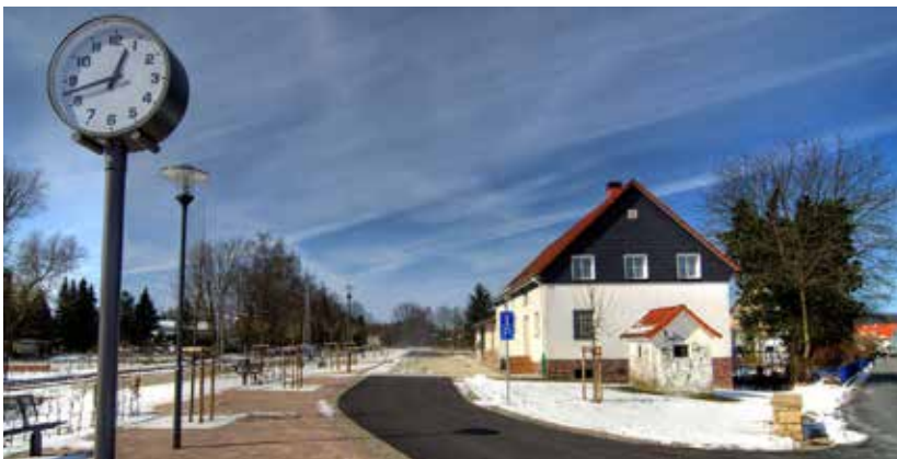
Das Odeon ist dank des Lipperlandorchesters zum „Kulturzentrum“ avanciert.

Und hier kommen die „mächtigen 77“ ins Spiel. Seinerzeit waren es insgesamt 77 Grundbesitzer, die in Alverdissen Bürgerrechte besaßen. Die Zahl 77 war ehernes Gesetz und blieb über Jahrhunderte, bis Anfang des 20. Jahrhunderts unverändert. Nur, wenn ein Bürgerrecht beispielsweise durch Tod frei wurde, konnte es neu vergeben werden. Voraussetzung dafür war allerdings, dass Bür-