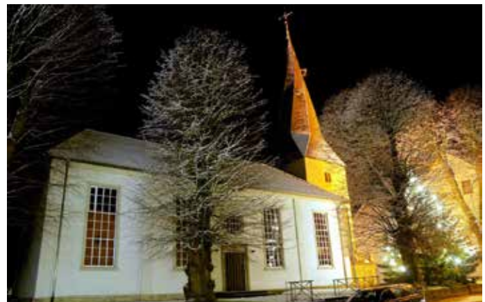
Die Alverdisser Kirche, erbaut 1842/43. Aber bereits seit dem 13. Jahrhundert soll an dieser Stelle eine Kirche gestanden haben.