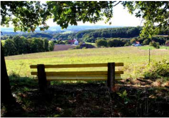
Fichtenbergbank: Fantastische Aussicht ins Nordlippische Bergland.