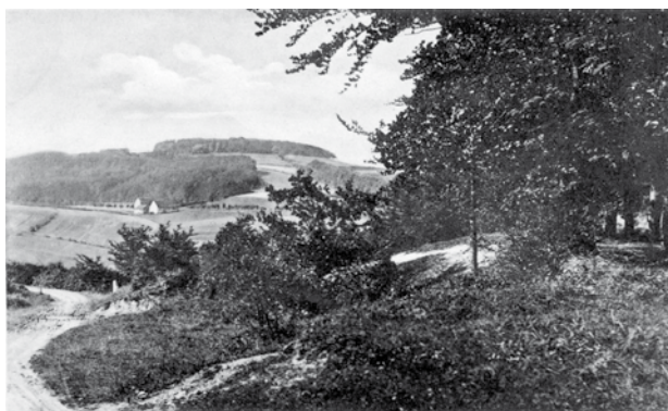
Boße Ascß, Böße 371 m

Jahre 1625: „Obwohl meinem Gnädigen Herrn zur Lippe von Monsieur Tilly Verheißung geschehen, daß die Untertanen in der Grafschaft Lippe verschont bleiben, so hat doch das tyrannische Volk nicht gehalten, sondern fahren fort und erobern mit Gewalt den Flecken Bösingfeldt (im Schein, das braunschweigische Gut, so darin verwahrt, zu suchen und zu erlangen) plündern, rauben und nehmen mit, was sie nur ansichtig werden, schlagen und verletzen die Einwohner. Das ist geschehen den 1. August“ (1625.) Auch der Siebenjährige Krieg brachte schwere Zeiten für den Flecken. Im Jahre 1756 wurde ein großer Teil von Bösingfeld durch eine Feuersbrunst zerstört; 1757 und 1758 lagen französische Truppen und während der letzten Kriegsjahre englische Truppen in Bösingfeld im Quartier. (Mitgeteilt von Herrn Schulrat Schwanold in Detmold.)