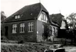
Schule Silixen ca. 1960