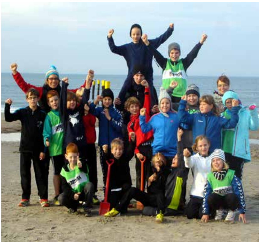
Surf- und Handballfreizeit Norderney, Sommer 2013.

Kehmeier: „Wir arbeiten eng mit den örtlichen Grundschulen zusammen. Das, was wir erstmalig im letzten Jahr gemacht haben, hat es im Handballkreis Lippe zuvor noch nie gegeben“. Drei Jugendtrainer betreuen intensiv die Drittklässler der Grundschulen Bösingfeld, Silixen und Humfeld. Ein Schnupperkurs Handball wird Teil des Sportunterrichts. „Nach vier Wochen Training veranstalten wir als