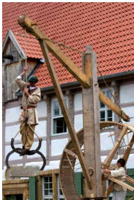
Der Laufradkran ist ein Blickfang auf jedem Mittelaltermarkt.

zu bombardieren und schließlich einzunehmen. Mit Wurf-Reichweiten von bis zu 450 Metern war die Blide eine der wirkungsvollsten und präzisesten Waffen der damaligen Zeit. Sie wurde zum Teil auf perfide Art eingesetzt, weiß Begemann, der zum Kenner in Sachen Mittelalter geworden ist. „Mit der Blide wurden nicht nur Steine gegen die Stadtmauern geschleudert – zielgenau immer wieder an die gleiche Stelle bis die Mauer nachgab