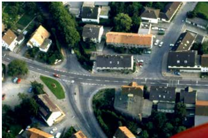
Die Kreuzung Bruchstraße, Mittelstraße, Schulstraße und Bahnhofstraße im Jahr 1980. Heute verbindet der Kreisell die Straßen.

Am Bahnhof 2 32699 Extertal ☎ 05262 - 33 09