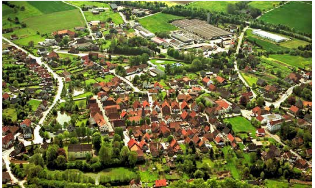
Der Flecken Alverdissen kann auf eine lange Geschichte zurückblicken. Gut zu erkennen ist das Drei-Straßen-System mit Schloßstraße, Vordere und Hintere Straße.

Zunächst wird den Besucher die Geschichte des Ortes interessieren, die