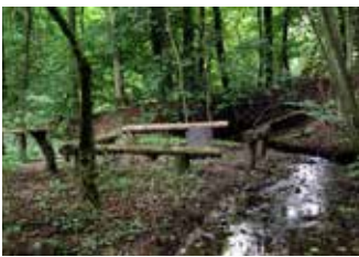
Rastplatz am Hagendorfer Bach