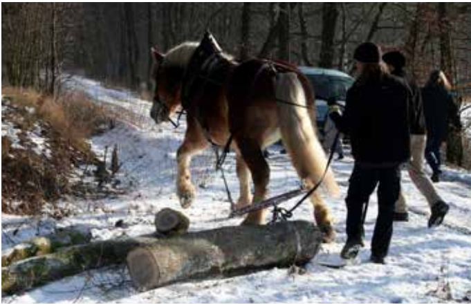
Holzrücken am Tag des Offenen Waldes.

die Vaterfigur“, beschreibt der Sozialpädagoge ein Problem der heutigen Gesellschaft, in der alleinerziehende Mütter fast schon zum Standard gehören.