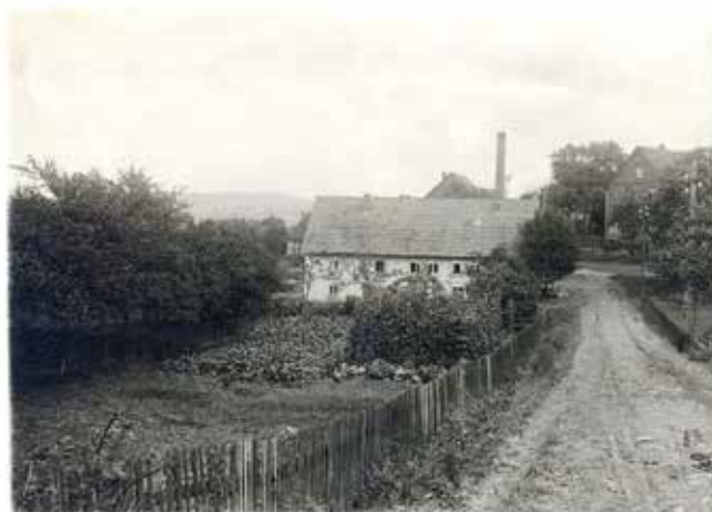
Mühle Silixen vor 1920