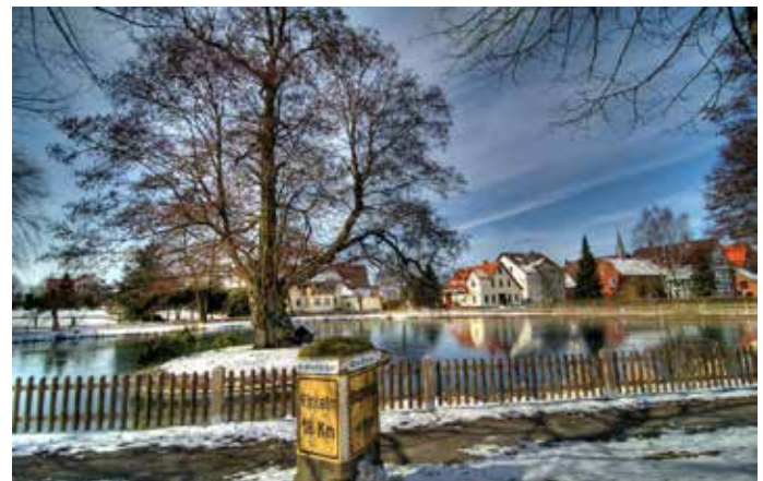
Der Menteteich in Alverdisen mit einer liebevoll restaurierten, alten Wegmarkierung.