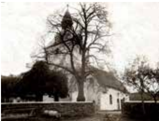
Kirche Silixen um 1900

Fragt man Willi Schirmmacher nach den Highlights, die er in all den Jahren Beschäftigung mit der Silixer Ortsgeschichte erlebte, muss er einen Moment überlegen, um dann in seiner bedächtigen Art zu antworten: „Eine ganz große Sache war das zwar nicht, aber ich war immer fasziniert