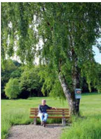
Die Birkenbank am Brückenweg in Nalhof - im vergangenen Jahr renoviert vom Brunnenverein Nalhof.

Aktion „Bänke für Bürger – Bürger für Bänke“